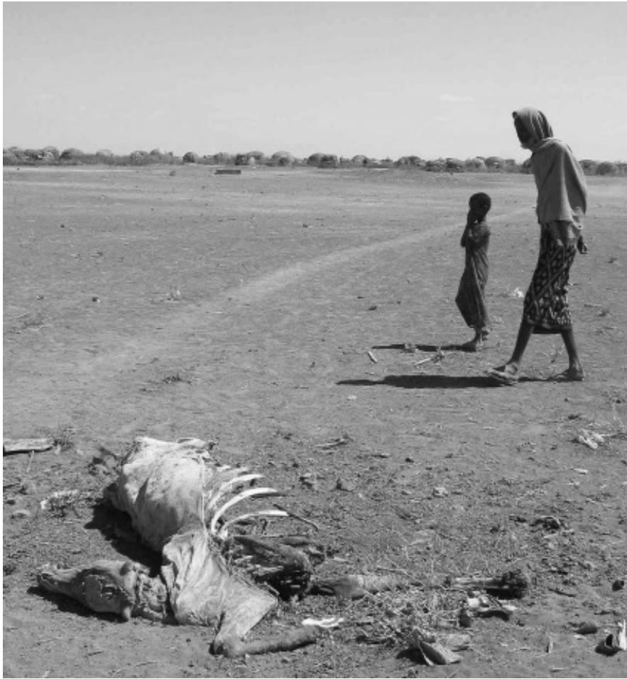
ඉතියෝපියාවේ ඩෙනන් (Denan) කලාපයේ තද නියතය, 2006.

නව මාක්ස්වාදී අධ්‍යයන කණ්ඩායමේ පරිවර්තනයකි අංක 15