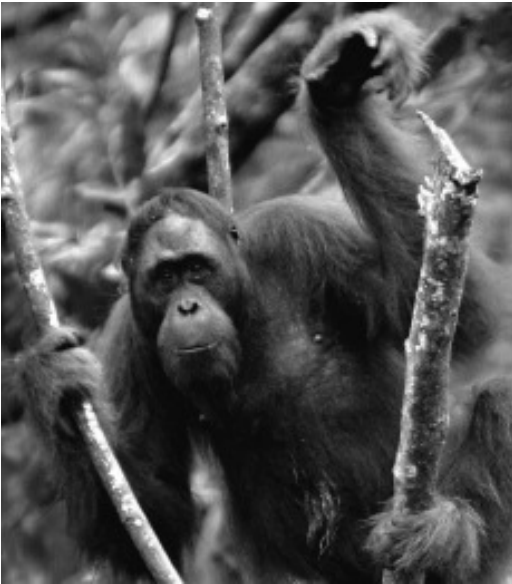
ඔරංඔටං - කලින්තාන්, ඉන්දුනීසියාව.

සේ බලපවත්වන තත්ත්වයන්හි අතිවිශාල මෙන්ම විශ්වනීය වෙනස්කම් ඇති වනු ඇත.