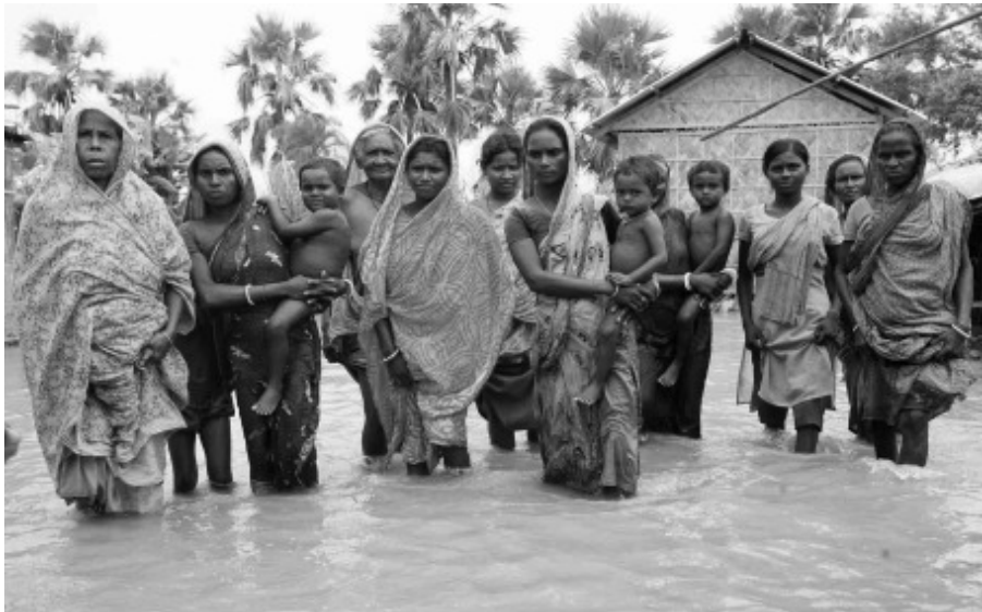
ගම්වැසියන් ගං වතුරට හසු වී, බංගලාදේශයේ ඩකාවලට නුදුරින්, 2008.

සමාජවාදය යටතේ මහජනතාව වූ කලි විශිෂ්ඨ වූ තනි සම්පතකි. තවද මානව වර්ගයා සත්‍ය ලෙසම ආරක්ෂා කර ගැනීමට සහ පෘථිවිය මත ජීවය සුරැකීමට, සමාජය ගොඩ නගන්නේ කෙසේද යන්න පැහැදිලි කර ගැනීමට ඔවුන් සියල්ලගේම නිර්මාණශීලී ශක්තිය, දැනුම සහ සංකල්පනාවන්, ජනතාව අරගලය සඳහා ඒකාග්‍ර කිරීම, සාකච්ඡා කිරීම, තර්ක හා විවාද කිරීමට මෙන්ම එකට එක්ව වැඩ කිරීමද කළ යුතුය. මේ ක්‍රමයෙන් මානව සමාජයට, වනාන්තර, මවිත කරවන සුන්දරත්වය සහ ස්වභාවයේ ඇති විවිධත්වය ඇගයීමට හැකි වන අතර ග්‍රහ ලෝකයේ ආරක්ෂකයන් ලෙස සවිඥාතව ක්‍රියා කළ හැකිය.