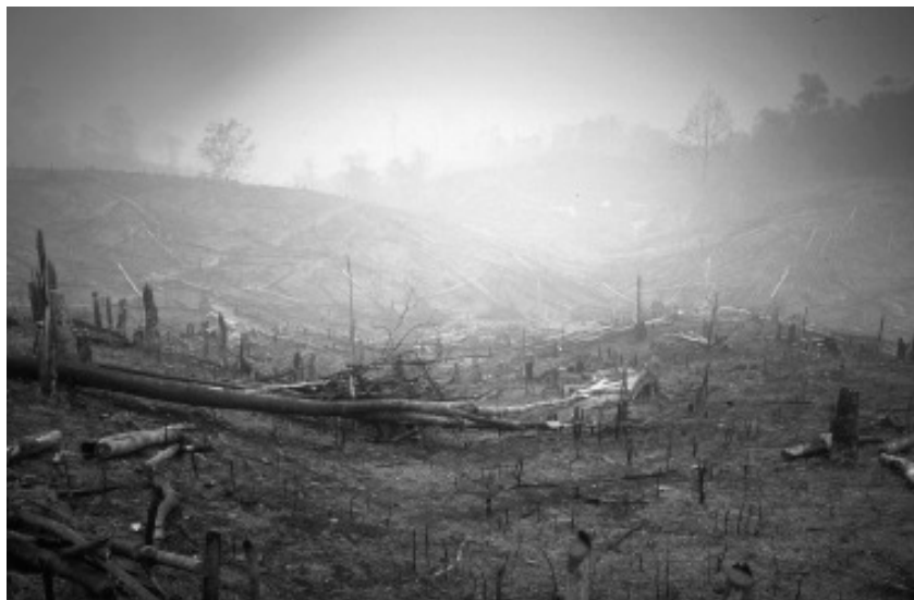
ඉන්දුනීසියාවේ දැව් ගිය වැසි වනාන්තරයක්.

ගල් අගුරු, තෙල් සහ වායු දහනය සහ වැසි වනාන්තර විනාශය නිසා මුහුදේ සහ වායුගෝලයේ උණුසුම ඉහළ යයි. වැසි වන වේගයකින් යුතුව ග්ලැසියර් සහ ධ්‍රැවයන්හි අයිස් ද්‍රව බවට පත් වෙයි. ඉහළ යන ගෝලීය උණුසුම හේතුකොට ගෙන අති බලවත් කුණාටු ඇති කරයි; කාලගුණ තත්ත්වය විකෘති කරයි. අප්‍රිකාව තුළ විශාල ප්‍රමාණයක් මිනිසුන් නිරන්තරයෙන් යුද්ධයෙන්, දරිද්‍රතාවයෙන්, සහ ආහාර හිඟ කමින් පීඩා විඳිනු ලබයි - මෙය අතිශය ප්‍රබල විනාශයකට මග පාදනු ඇත.