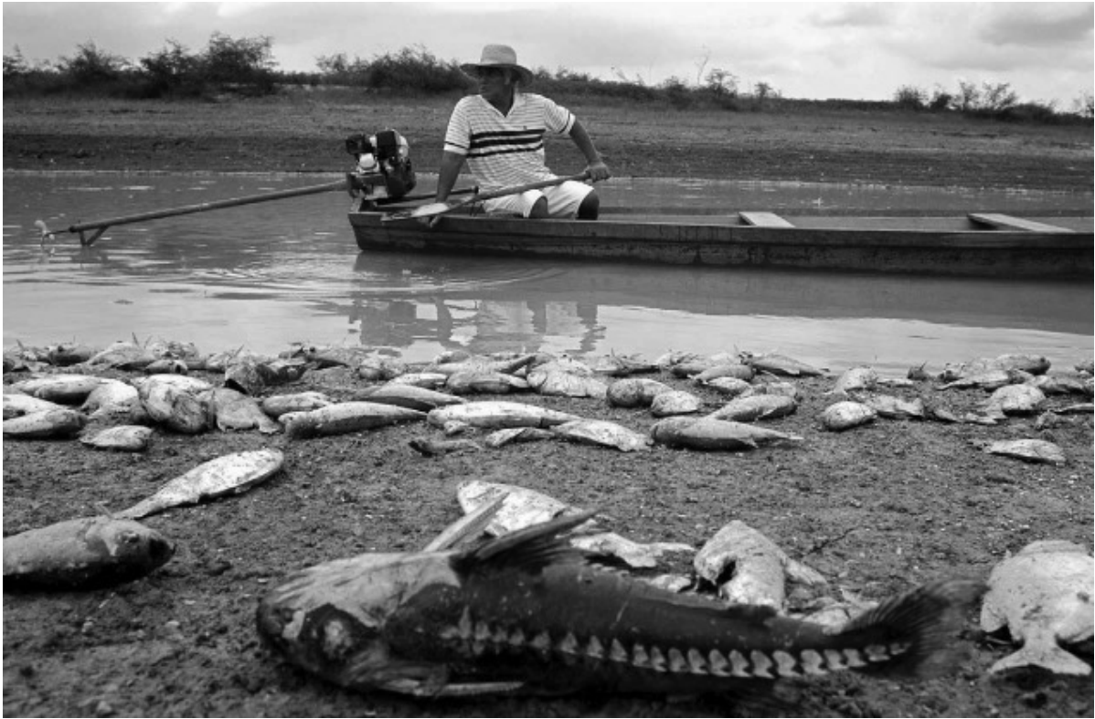
බුසිලයේ කරෙයිරෝ ද වාර්ෂික (Careiro da Varzea) නගරයට ආසන්නයේ පිහිටි රෙයි (Rei) වැවේ ඉවුර මත මියගිය මත්ස්‍යයින් පරික්ෂා කරන මිනිසෙක්. 2005 වසරේදී මාස ගණනක් පුරා පැවති තද ඉඩෝරය හේතුකොටගෙන ඇමෙසන් ගඟේ ජල මට්ටම අඩි කිහිපයකින් පහළ බැස තිබුණි. 2009 වසරේදී ප්‍රජාව විසින් ගං වතුර සමයේ නැවති සිටීමට තාවකාලික මහල් නිවාස ගත දිගේ සාදනු ලැබුණි.

ලෝකයේ ප්‍රමුඛ පෙළේ කාලගුණ විද්‍යාඥයෙක් ළඟ එන කෝපන්හේගන් කාලගුණ සමුළුව ගැන නොවළඟා කතා කරමින් ප්‍රකාශ කර සිටියේ, සමුළුව අවසානයේ නම් ඔවුහු ග්‍රහලෝකයේ සහ අනාගත පරපුරුවල යහපත ගැන කතා කරුවී.