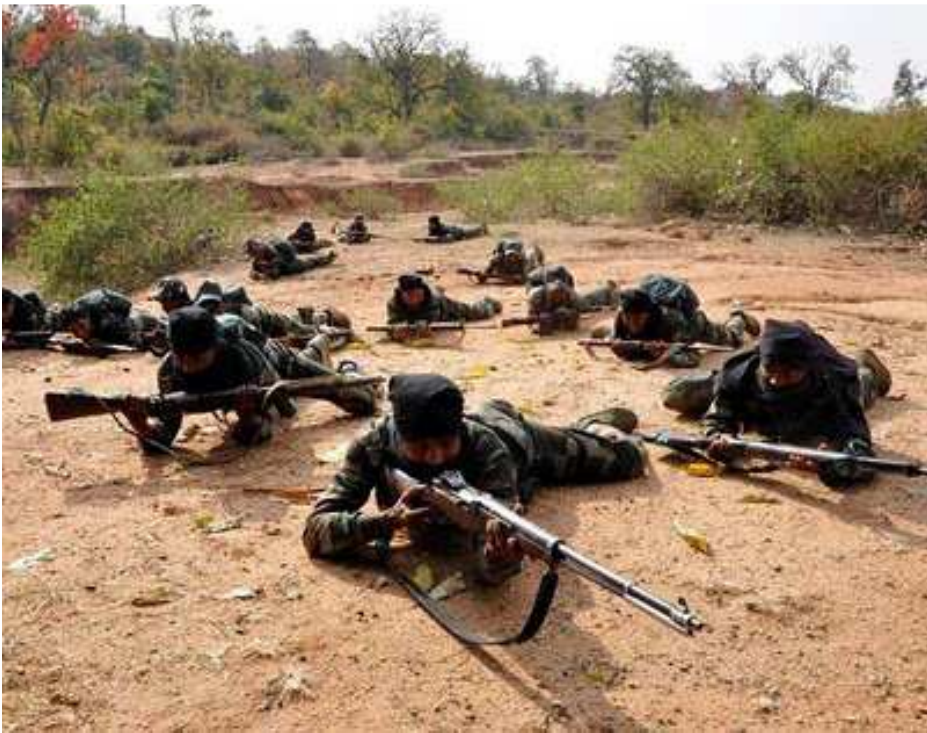
මාඕවාදී මහජන විමුක්ති ගරිල්ලා හමුදාව

කාලය තුළදී පැරාමිලිටරි බල ඇණි (CRPF) බස්නාට් කලාපය තුළ පළමු වතාවට විහිදුවන ලදී. හිටපු මධ්‍යම ඇමති විසි ශක්ලා ස්වදේශ කටයුතු ඇමති ධුරය ඇතුළුව විවිධ අමාත්‍ය ධුරයන් දරා ඇති බව කිසිවෙකුට සැඟවිය නොහැකි දෙයක් සේම සුරාකන රජයේ ප්‍රතිපත්ති ක්‍රියාවට නැංවීමේදී ප්‍රමුඛ පෙළේ කාර්යභාරයක් ඉටු කළ, අධිරාජ්‍යවාදීන්ගේ, කොමිප්‍රදෝරු නිලධාරීවාදී ධනපති පංතියේ සහ ඉඩම් හිමියන්ගේ සුවච කිකරු සේවකයෙකු ලෙස ක්‍රියා කළ අයෙක් විය. මේ ප්‍රභාරයේ මූලික අරමුණ වූයේ මහේන්ද්‍ර කර්මා සහ කොංග්‍රස් පක්‍ෂයේ අනෙක් ඉහළ පෙලේ ප්‍රතිගාමී නායකයින් මුලිනුපුටා දැමීමයි. කෙසේ හෝ, පැය දෙකකට ආසන්න කාලයක් තිස්සේ ඇදී ගිය, සන්නද්ධ පොලිස් බල ඇණි සහ ගරිල්ලා බල ඇණි අතර සිදුවූ දීර්ඝ වෙඩි හුවමාරුවේදී අහිංසක මිනිසුන් කිහිප දෙනෙකු සහ පහළ මට්ටමේ කොංග්‍රස් පක්‍ෂ ක්‍රියාකාරකයින් මරණයට පත්වීමට සහ තුවාල විමට භාජනය වූ අතර ඔවුහු අපගේ සතුරෝ නොවෙති. ඉන්දියානු කොමියුනිස්ට් පක්‍ෂය (මාඕවාදී) හි දන්දකර්ණයා විශේෂ කලාප කමිටුව මේ පිළිබඳව ශෝක වන අතර මරණයට පත් වූ අයගේ පවුල් වෙත සිය ශෝකය සහ සංවේගය ප්‍රකාශ කරයි.